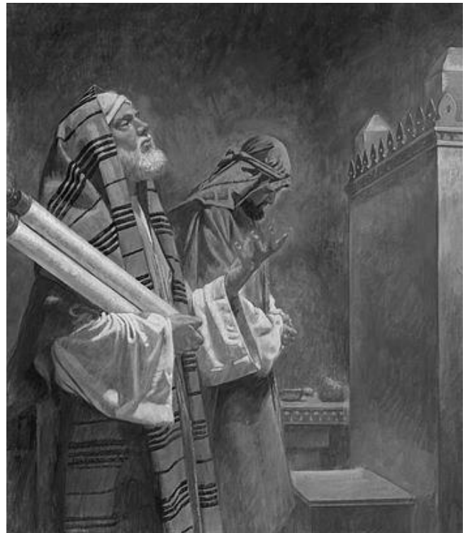
El Salvador condenó las reglas inventadas por los rabinos que eran puestas por encima de la Ley de Elohim.

propio. El pueblo era engañado por ellos. Llevaba pesadas cargas que Elohim no le había impuesto. Aun los discípulos del Mesías no estaban completamente libres del yugo de los prejuicios heredados y la autoridad rabínica. Ahora, revelando el verdadero espíritu de los rabinos, Yahoshúa trató de libertar de la servidumbre de la tradición a todos los que deseaban realmente servir a Elohim. "Hipócritas -- dijo, dirigiéndose a los astutos espías,-- bien profetizó de vosotros Isaías, diciendo: Este pueblo de labios me honra; mas su corazón lejos está de mí. Mas en vano me honran, enseñando doctrinas y mandamientos de hombres." Las palabras del Mesías eran una requisitoria contra el fariseísmo. El declaró que al poner sus requerimientos por encima de los principios divinos, los rabinos se ensalzaban más que a Elohim.