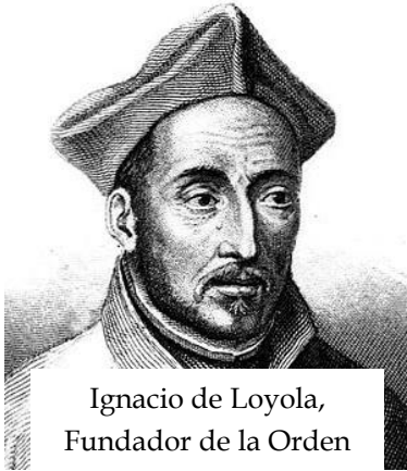
Ignacio de Loyola, Fundador de la Orden

Al darse a conocer como miembros de la orden, se presentaban con cierto aire de santidad, visitando las cárceles, atendiendo a los enfermos y a los pobres, haciendo profesión de haber renunciado al mundo, y llevando el sagrado nombre de Jesús, de Aquel que anduvo haciendo bienes. Pero bajo esta fingida